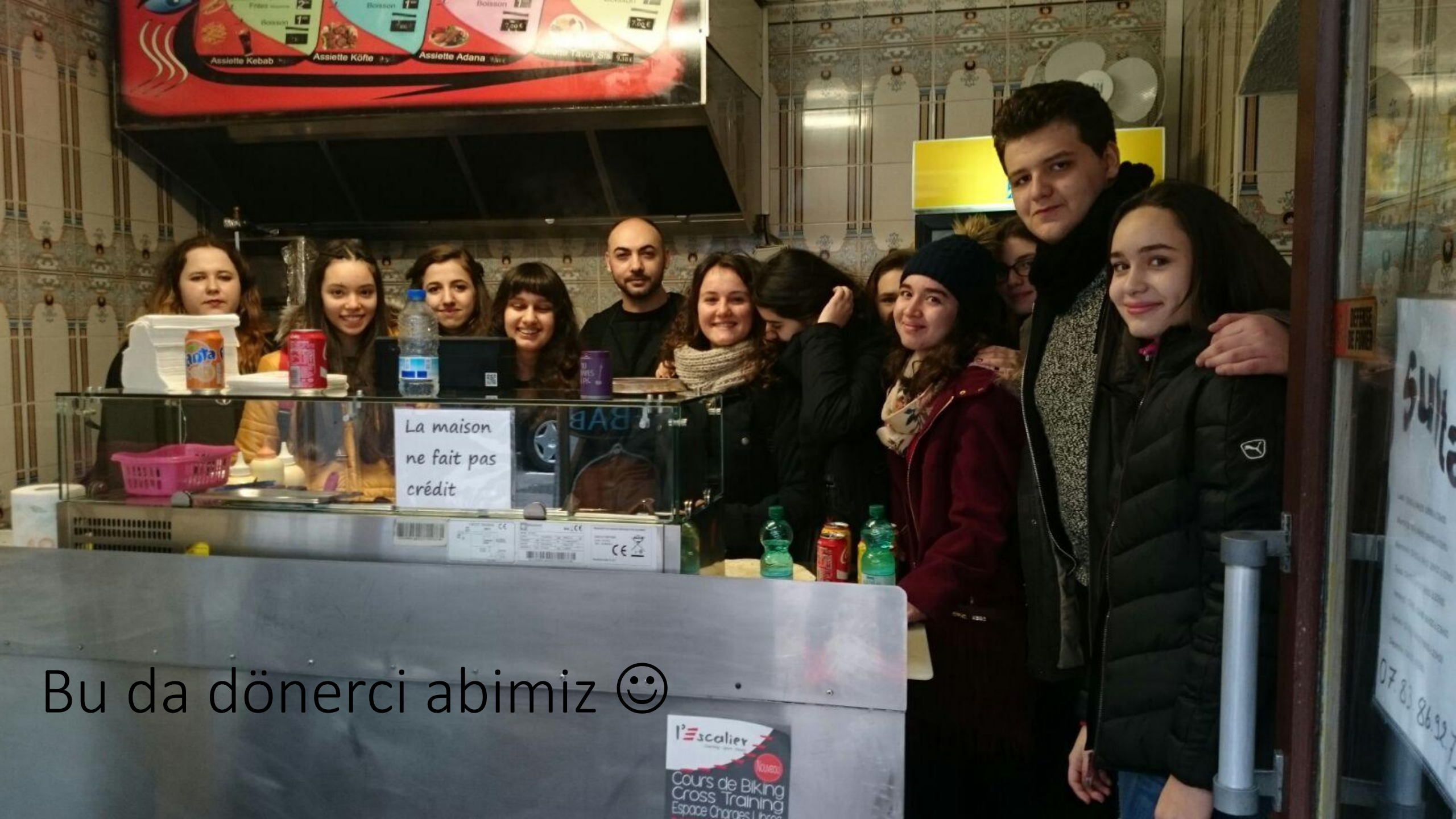
Bu da dönerci abimiz 😊

l'escalier Cours de Biking Cross Training Espace Charges 1 heure